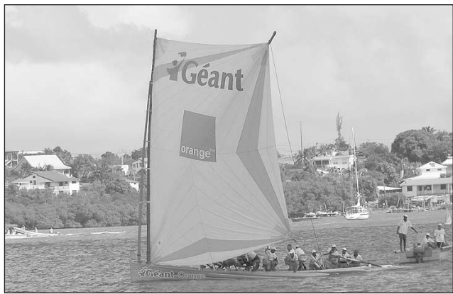
« Yol Robè en mouvement » a visiblement du mal à décoller

Initiée en 2004 par la ville et son office du tourisme, la manifestation, « Yol Robè en mouvement » n'a pas l'air de « prendre » cette année. L'idée est d'utiliser les jours d'entraînements des voleurs pour impulser une attraction de plus dans la baie du Robert. Les différents acteurs s'étaient réunis en début d'année pour tout préparer. Le principe ? Tous les 15 jours, le samedi, la baie du Robert devait être animée par les yoles pour le plus grand bonheur des amateurs. La manifestation ayant débuté le 2 avril dernier, nous devions en être ce week-end au quatrième samedi d'animation. Oui mais voilà, l'une