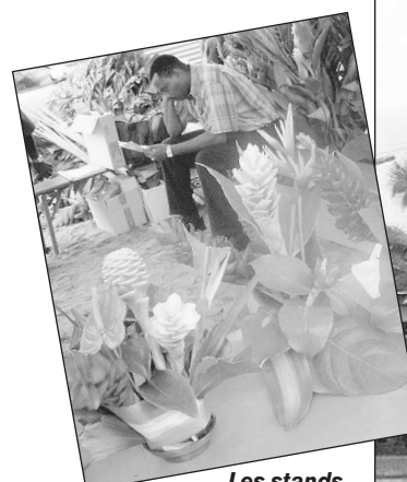
Les stands consacrés aux fleurs et compositions florales ont attiré un grand nombre de visiteurs.

Samedi, dès les premières heures de la matinée, ils étaient tous présents sur le boulevard Désir-Jox : exposants, animaux, et visiteurs réunis pour cette grande fête de la production agricole martiniquaise.