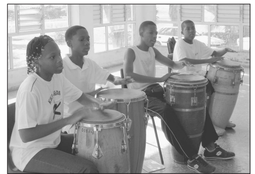
Les jeunes musiciens de l'ensemble instrumental du collège Paul-Symphor se produisent ce soir.

L'ensemble instrumental du collège Paul-Symphor du Robert donnera ce soir un concert à l'office municipal de la culture de Trinité. Grâce à l'art, l'équipe éducative pousse les adolescents à se dépasser : un atelier musique a été créé afin d'amener les collégiens à s'investir et faire preuve de ténacité. Dernièrement, ces jeunes se sont rendus à Cuba.