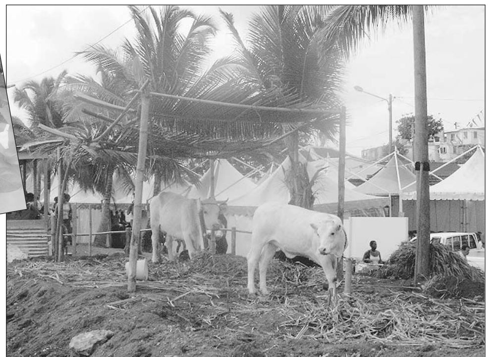
La filière bovine occupait cette année la place d'honneur.

La foire représente une bonne occasion de s'informer auprès des professionnels.